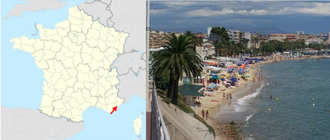
Geographische Lage Vallauris

Ziel: 06220 Vallauris (Département Alpes-Maritimes) ca. 27.000 Einwohner Region Provence-Alpes-Côte d'Azur